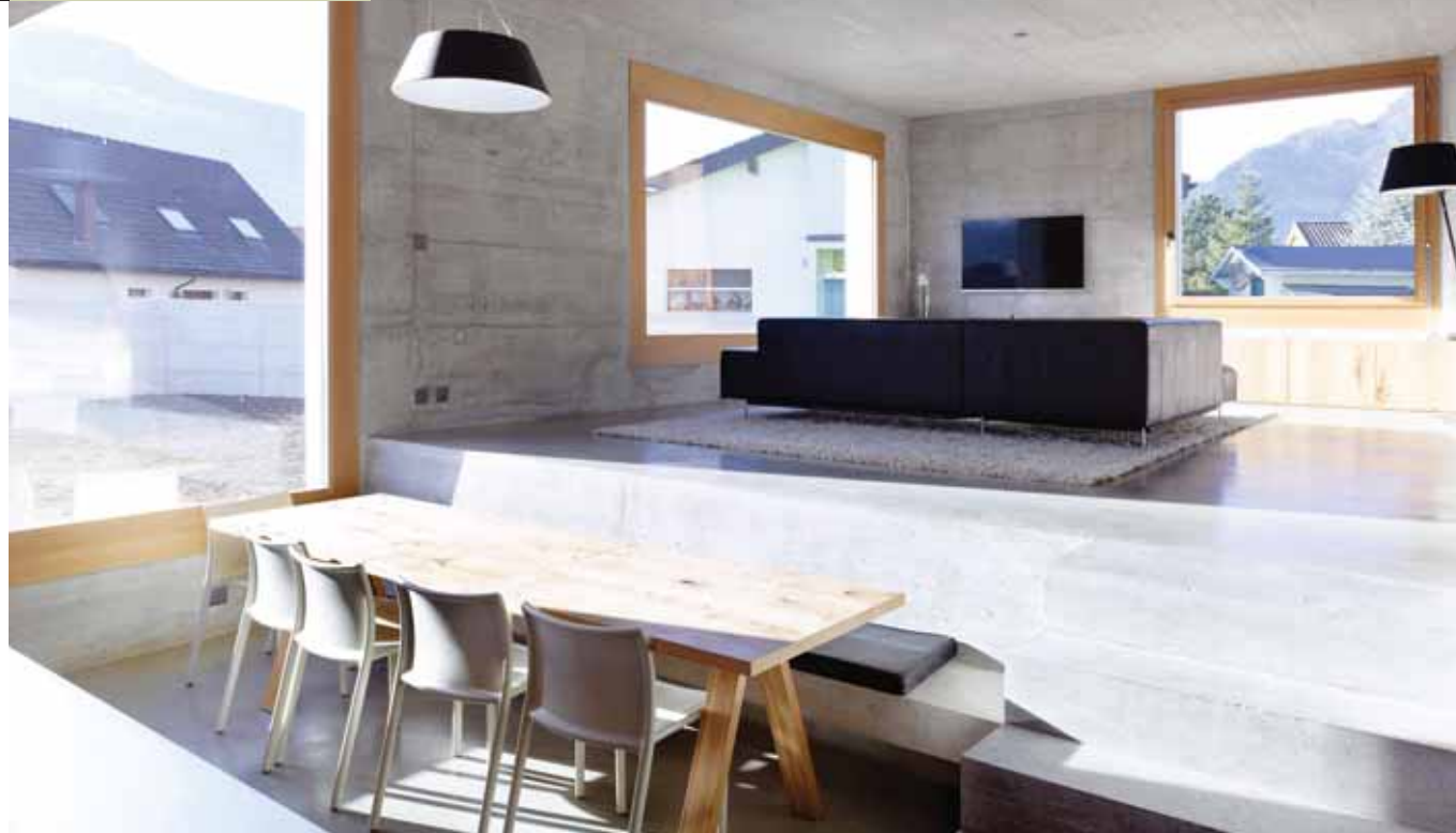
L'aménagement des pièces en demi-paliers permet à chacun de s'isoler sans rompre le contact avec le reste de la famille.