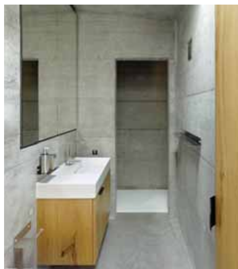
La salle d'eau minimaliste est volontairement réduite à sa fonction initiale.