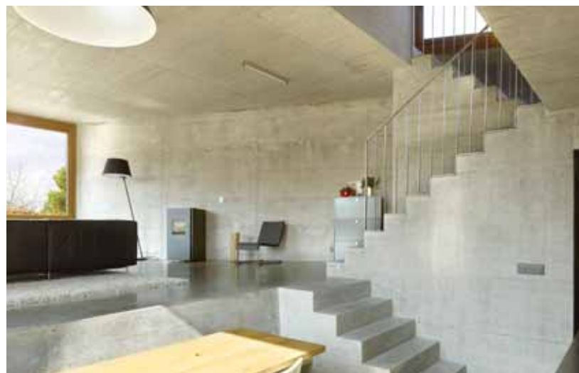
L'escalier central est un espace vivant où l'on se parle, s'appelle et guette les visiteurs.