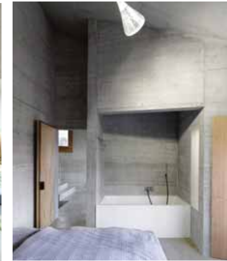
La baignoire dans son alcôve de béton est orientée sur le paysage.