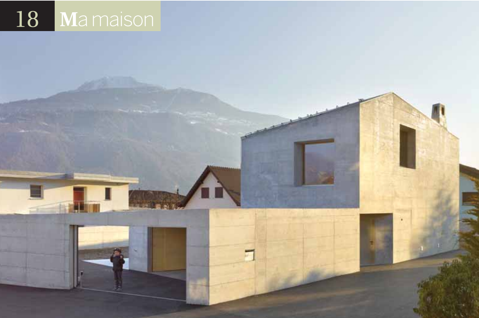
Bâtiment principal, annexes et agencements extérieurs ne forment qu'un tout.