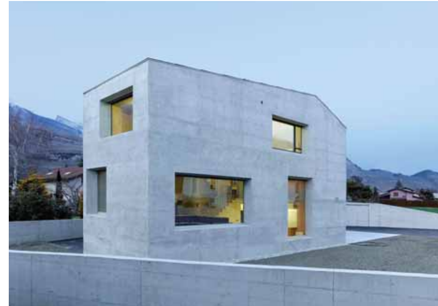
Les fenêtres balayent tous les panoramas aux alentours: Nendaz, Mont Orge et Haut de Cry.