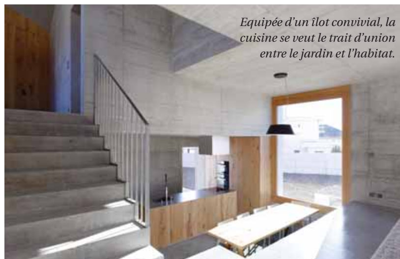
Equipée d'un îlot convivial, la cuisine se veut le trait d'union entre le jardin et l'habitat.