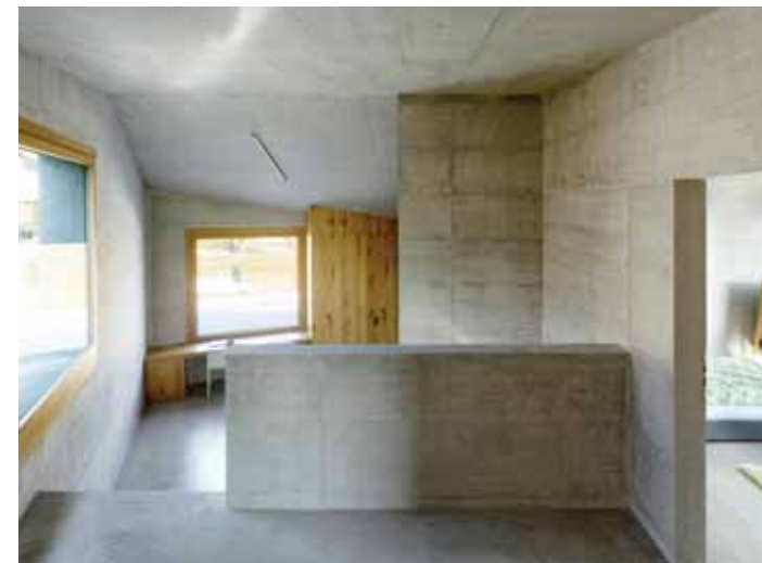
Le bureau est une pièce ouverte et polyvalente. Pour les devoirs des enfants comme pour le repassage.

Le choix du «tout béton» armé et apparent n'est pas anodin. Ce matériau se prête à de multiples agencements comme des bancs et des escaliers et confère à l'ensemble du bâtiment une vision d'unité et de minimalisme. Il s'accorde avec un autre matériau brut comme le chêne sauvage dans l'espace cuisine, conçue sur le principe de l'ultra sur-mesure. «Toutes les armoires sont intégrées pour une fonctionnalité optimale. Rien n'empêche le regard. L'idée étant aussi de réduire les tâches ménagères à leur plus simple expression.» Les salles d'eau n'échappent pas à l'emprise béton, la douche étant toutefois réalisée dans un revêtement de résine blanc. Baignoire, vasques et WC sont en porcelaine. «Il ne s'agit pas de faire du beau et du joli à tout prix en misant sur l'esthétique de parquets précieux ou sur des objets de déco magnifiques mais plutôt d'aller à l'essentiel avec une organisation de l'espace très fonctionnelle et une qualité architecturale propice à la convivialité.» Un objectif manifestement atteint dans cette maison où tout le monde avoue se sentir bien.